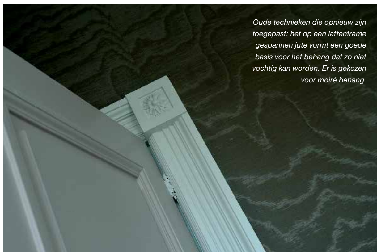
Oude technieken die opnieuw zijn toegepast: het op een lattenframe gespannen jute vormt een goede basis voor het behang dat zo niet vochtig kan worden. Er is gekozen voor moiré behang.

Aan de interieurafwerking ging veel onderzoek vooraf. Om de kleurstelling van een oorspronkelijk stuk granito, aangetroffen in de hoofdgang van de poortwoning, zo dicht mogelijk te benaderen werden monsterstukken gemaakt. Kleurentrapjes brachten alle houtverflagen uit het verleden in het zicht. Ook hielp dat bij het afpellen van de ruimtes sporen van oudere afwerkingen bloot kwamen te liggen, zoals randjes van behang en een wandbespanning. Op basis van al deze informatie kon het team afgewogen keuzes maken. De bouwsporen zijn overigens zo veel mogelijk bewaard en door de nieuwe afwerkingslagen aan het oog onttrokken. Naar aanleiding van restanten van spanbehang achter