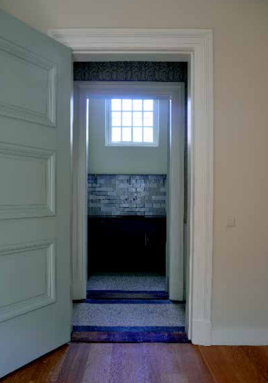
Doorkijkje vanuit de zitkamer in de poortwoning naar de keuken.