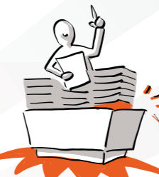
FOCUS REGELGEVER EN TOEZICHTHOUDER

O, DAT HAD IK NOG NIET GEZIEN, ENNEH... IK MOET ME ER EERST IN VERDIEPEN