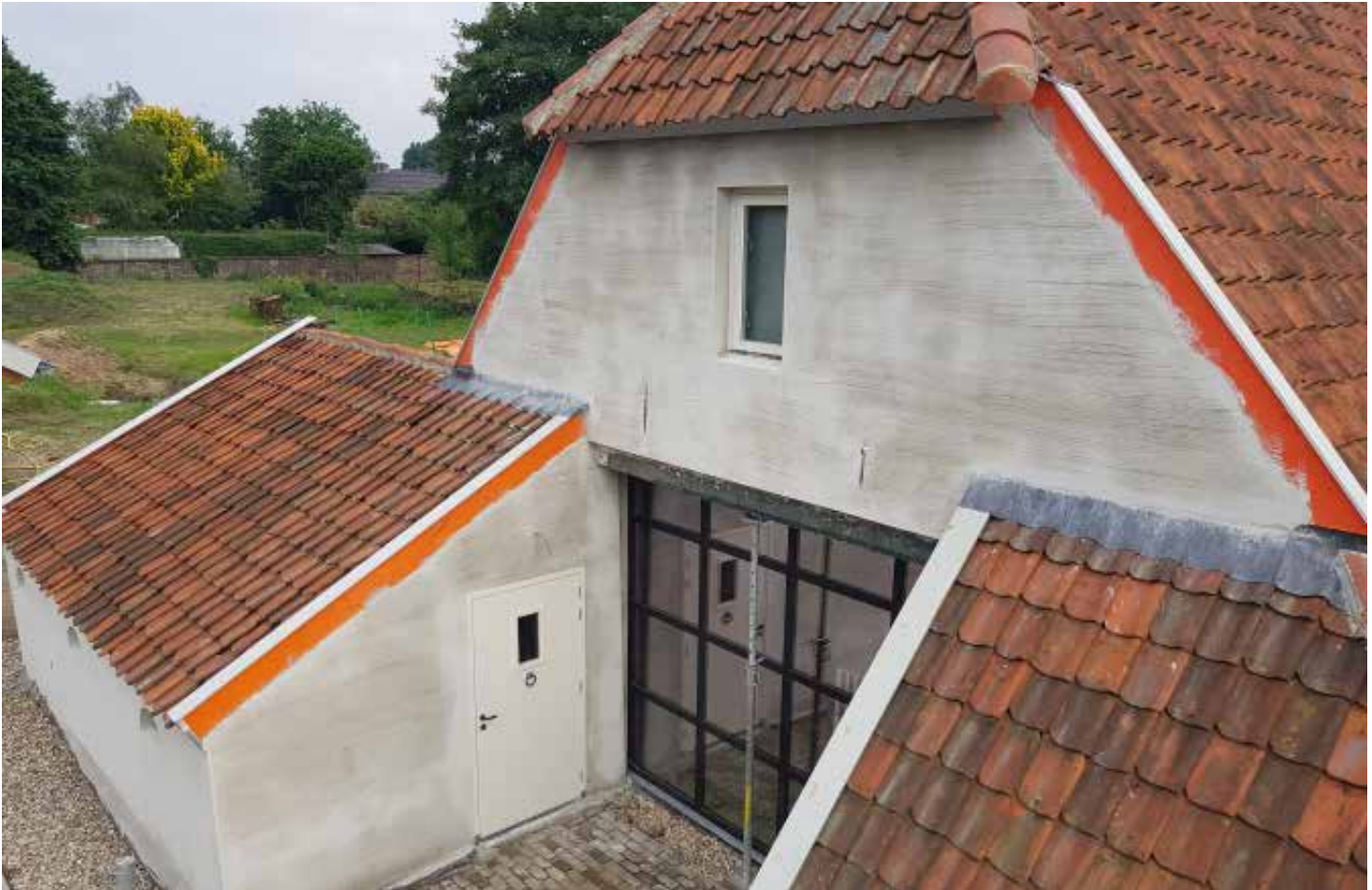
Op de plek van de oude staldeuren is een grote stalen pui geplaatst. Het wolfseind is op basis van bouwsporen in de kap en historische buurtfoto's aangebracht.

IJsselsteentjes zijn verwerkt in de wc-ruimte. Alle historische materialen en vondsten zijn zo mogelijk opnieuw gebruikt. Zoals eeuwen voor ons al is gedaan, ook bij de paarse boerderij zelf. Het pand uit circa 1800 is opgetrokken uit bouwmaterialen uit allerlei periodes, tot de vijftiende eeuw aan toe. Deze zijn waarschijnlijk van elders aangevoerd.