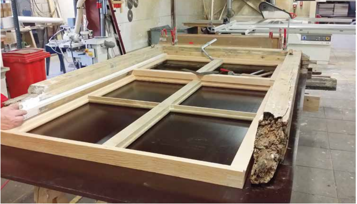
In de werkplaats van Cuppens +zn zijn de oude kozijnen zorgvuldig hersteld met behoud van zoveel mogelijk historisch materiaal. Een staaltje vakmanschap!