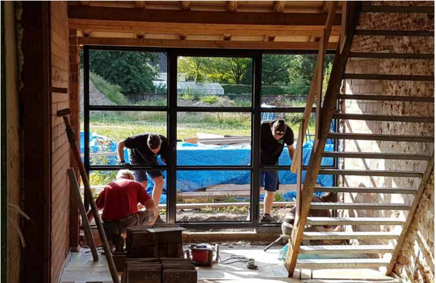
In de zijgevel wordt een stalen kozijn geplaatst voor meer daglicht in de deel.