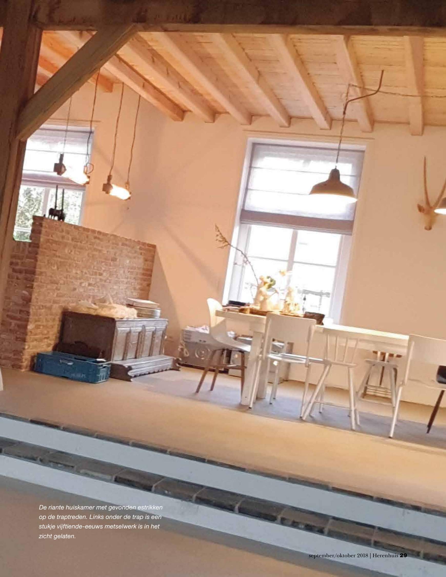
De riante huiskamer met gevonden estrikken op de traptreden. Links onder de trap is een stukje vijftiende-eeuws metselwerk is in het zicht gelaten.