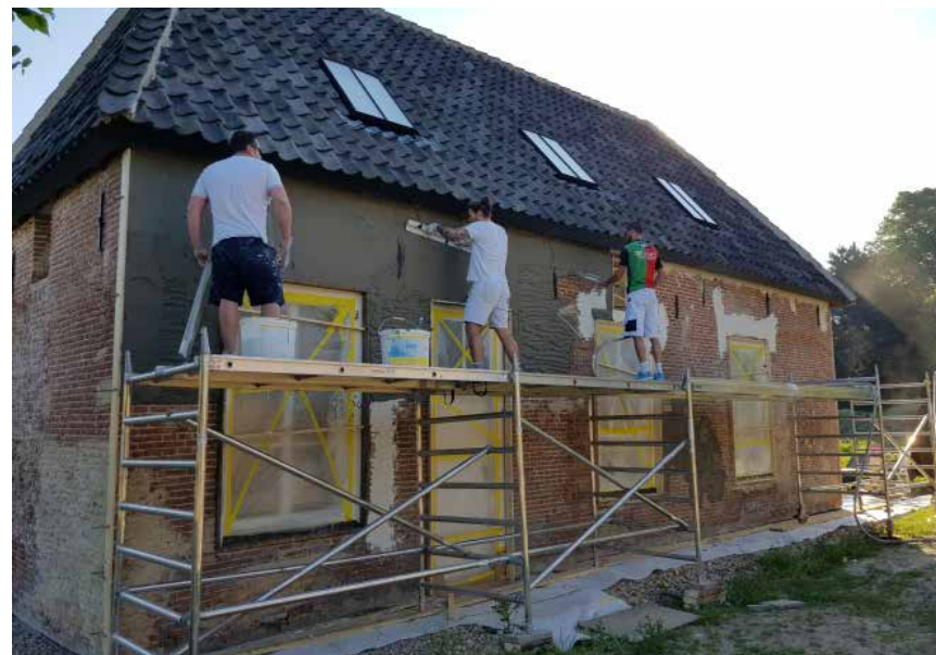
De gevels worden gestuct.

Aangetroffen estrikken en IJsselsteentjes zijn opnieuw verwerkt