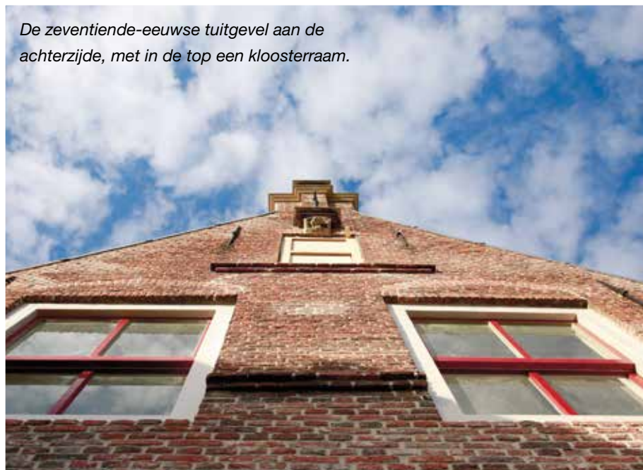
De zeventiende-eeuwse tuitgevel aan de achterzijde, met in de top een kloosterraam.