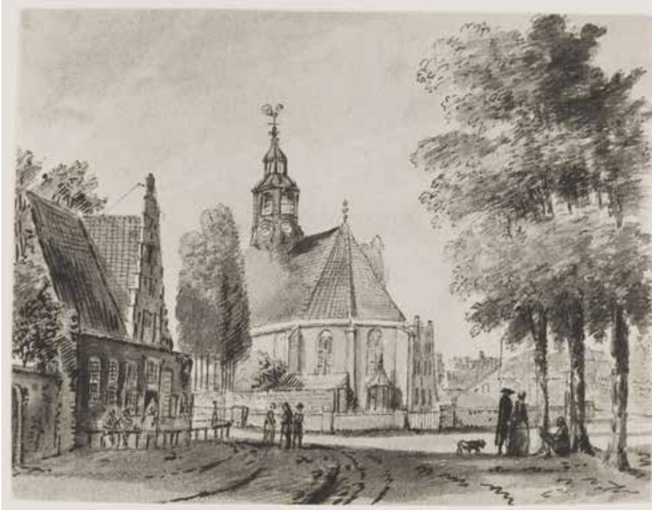
Een tekening uit 1768 toont de voorzijde van Het Wapen van Heemstede met de trapgevel, die bij de verbouwing rond 1780 werd vervangen door een lijstgevel. De herberg ligt prominent naast de Oude Kerk van Heemstede.