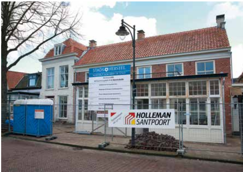
Voorzijde van het Wapen van Heemstede met links nummer 4, het woonhuis met twee verdiepingen en mansardedak.