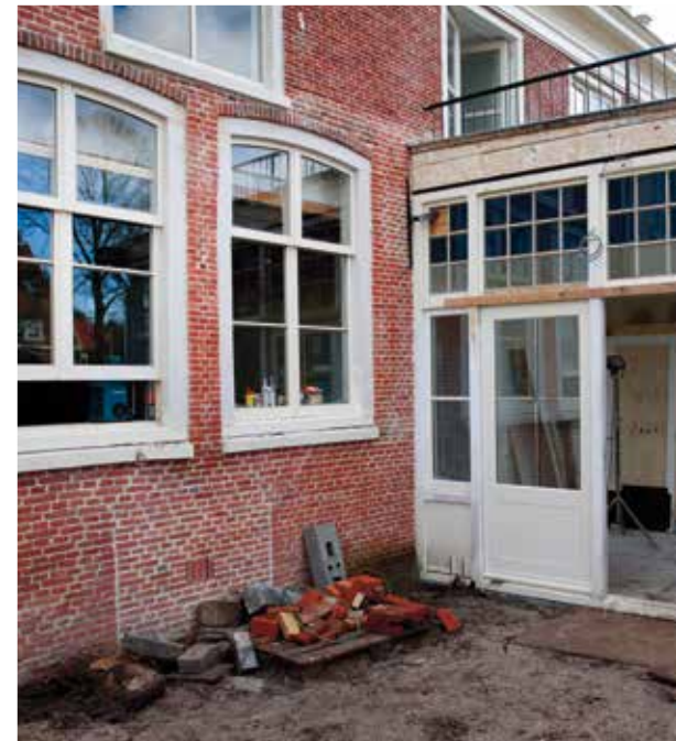
De voorgevel is ontdaan van de witte verflaag waardoor het zeventiende-eeuwse metselwerk met originele voeg weer zichtbaar is.

Nadat de plannen zijn goedgekeurd, kan de sloop van de bijgebouwen beginnen. Maar al snel blijkt dat de gevels van het hoofdgebouw onder het gewicht van de kap zijn gaan wijken en de bijgebouwen het oorspronkelijke pand feitelijk overeind houden. De oorzaak: bij eerdere verbouwingen zijn op diverse plaatsen spanten